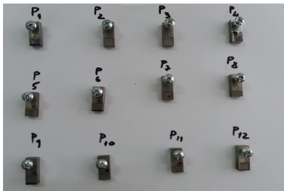
Fig. 3. Setul de probe analizate metalografic.

Probele au fost codificate și supuse prelucrării pe 2 suprafețe opuse (fig. 3) apoi s-au prelevat zone din porțiunea retopită cu laser pentru analiza metalografică. Parametrii regimului de prelucrare cu laser sunt prezentați în tabelul 2.