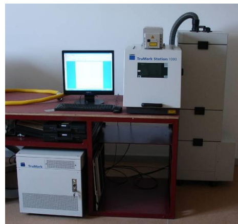
Fig. 1. Instalația de prelucrare cu laser.

Prelucrarea cu laser a probelor din aliaje FeCrAl s-a realizat cu ajutorul unui ECHIPAMENT DE GRAVARE CU LASER Nd: YAG - TruMark STATION 1000, TRUMPF din dotarea firmei Optoelectronica (fig. 1).